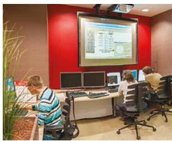
SALLE E-MONITORING DTG

DTG travaille ainsi à la mise en place d'une organisation fonctionnelle dédiée au service des trois parcs, avec la création à Grenoble d'un centre d'expertise spécialisé.