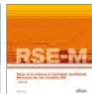
RSE-M SURVEILLANCE EN EXPLOITATION