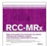
RCC-MRx MATERIELS MECANIQUES