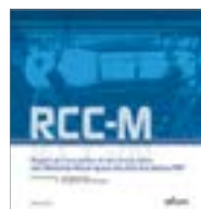
RCC-M MATERIELS MECANIQUES