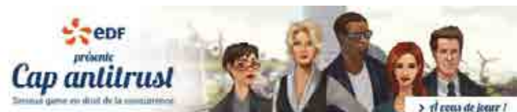
Cap Antitrust - Serious Game en Droit de la concurrence