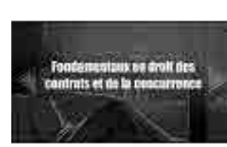
Droit des contrats et de la concurrence