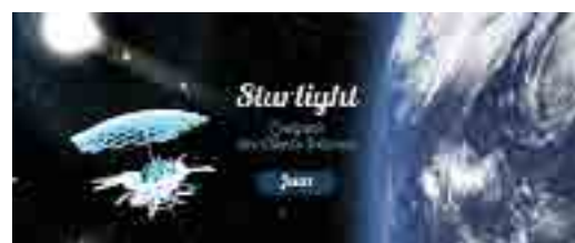
Startlight, le serious game des services et des clients internes