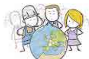
MOOC Marché de l'électricité