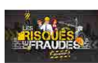
Sensibilisation aux risques de fraude au sein du Pôle Immobilier