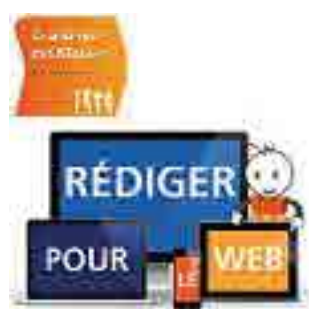
Rédiger pour le web