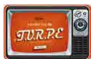
Tarif d'utilisation du réseau public d'électricité