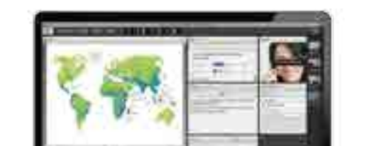
Adobe Connect Meetings