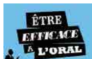
MOOC Être efficace à l'oral