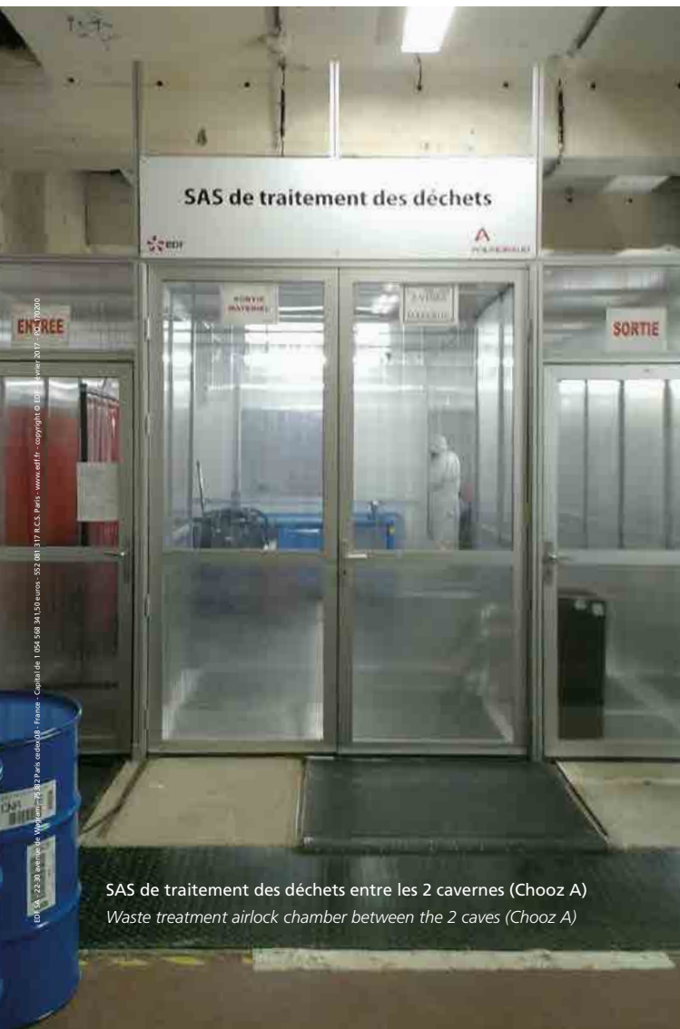
SAS de traitement des déchets entre les 2 cavernes (Chooz A) Waste treatment airlock chamber between the 2 caves (Chooz A)

At Chooz A and particularly in the reactor building, a number of workshops have been temporarily installed. These include waste encapsulation workshops as well as the maintenance workshop for under-water cutting tools.