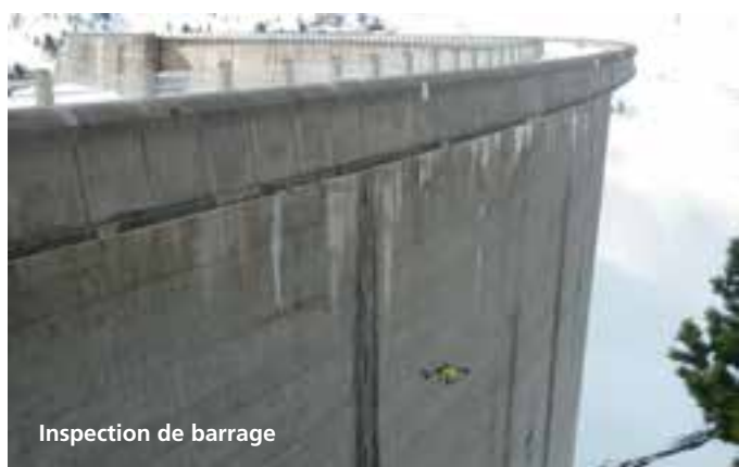
Inspection de barrage