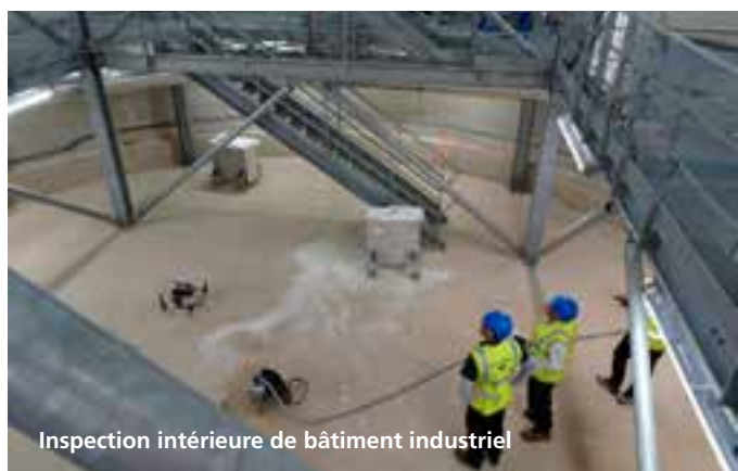
Inspection intérieure de bâtiment industriel