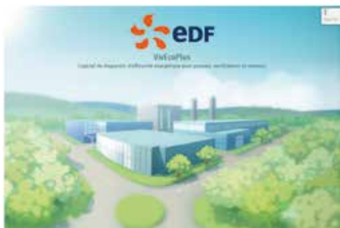
Logiciel de calcul d'économies et investissements